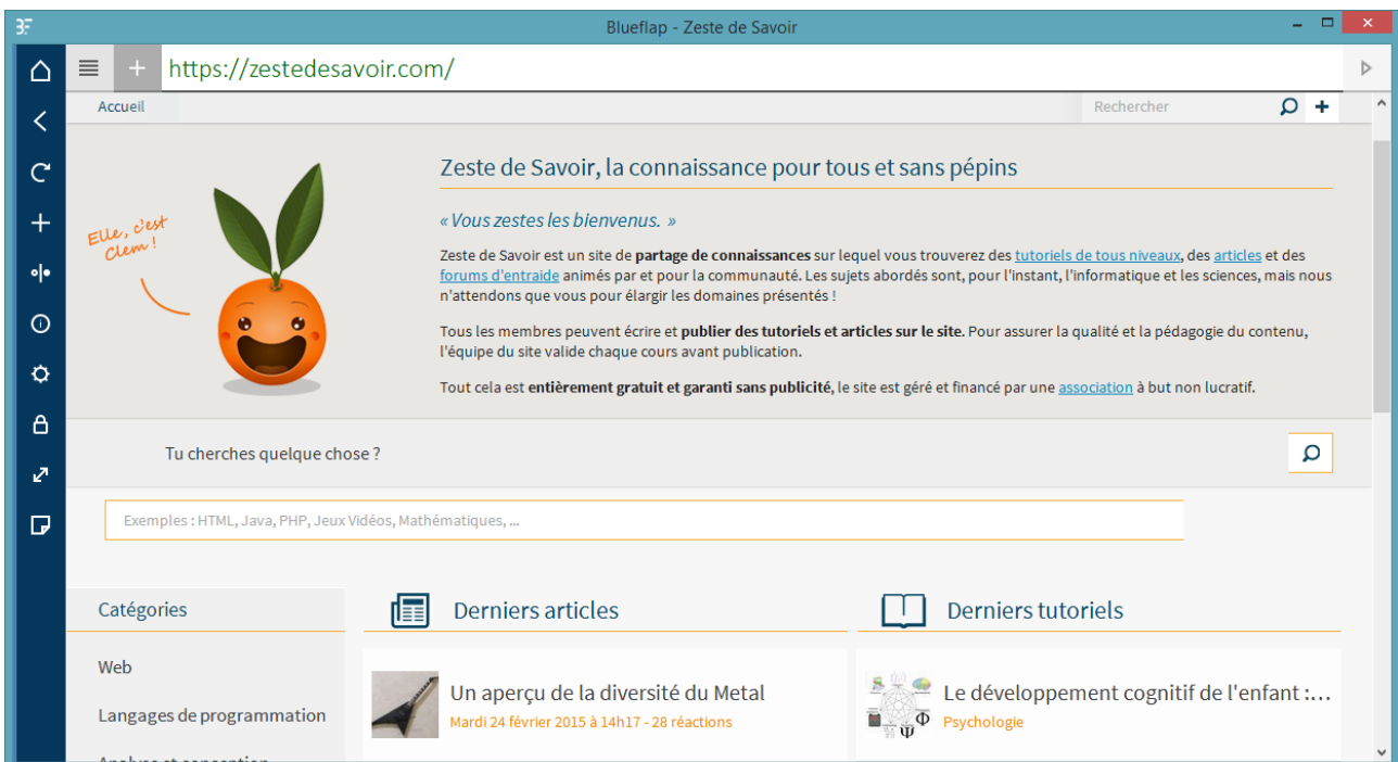
FIGURE 0. – Blueflap 4.0 BETA