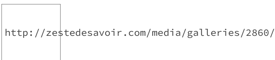
FIGURE 2. – Indication de tailles des fichiers téléchargeables

Vous remarquerez également que la taille de chaque fichier téléchargeable est désormais indiquée.