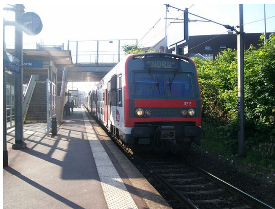
FIGURE 1. – Z8800 sur le RER C, avec l'ancienne livrée.

Comme les Z8800 donnent satisfaction, la SNCF décide de passer commande d'un matériel semblable mais disposant des dernières innovations ferroviaires. Cela permet également d'anticiper le vieillissement du matériel roulant. Ainsi naissent les Z20500 ↗ , qu'on retrouve sur les RER C et D ainsi que les lignes P et R.