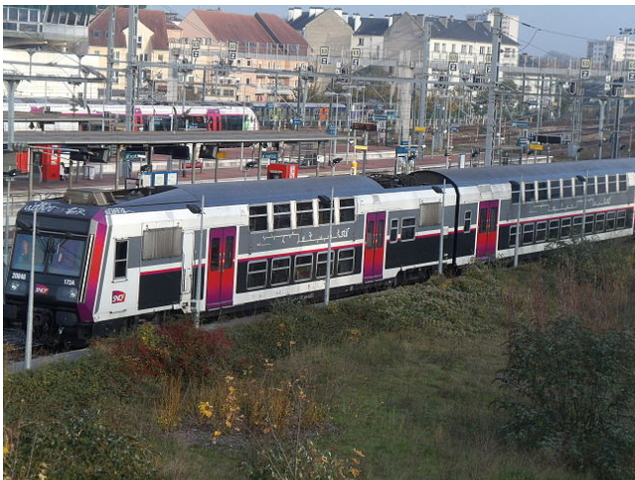
FIGURE 1. – Z20500 avec la livrée Transilien, la même que celle de la NAT qu'on voit dans le fond. Téléversé sur Wikipédia par Spendeau sous licence CC BY-SA 3.0

Comme les Z8800 donnent satisfaction, la SNCF décide de passer commande d'un matériel semblable mais disposant des dernières innovations ferroviaires. Cela permet également d'anticiper le vieillissement du matériel roulant. Ainsi naissent les Z20500 ↗ , qu'on retrouve sur les RER C et D ainsi que les lignes P et R.