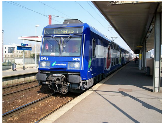
FIGURE 1. – Z20900 sur la VMI.

Ces rames sont uniquement affectées au RER C. Donc si tu ne sais pas où tu es mais que tu en vois une passer, une gare de la ligne C n'est sans doute pas loin.