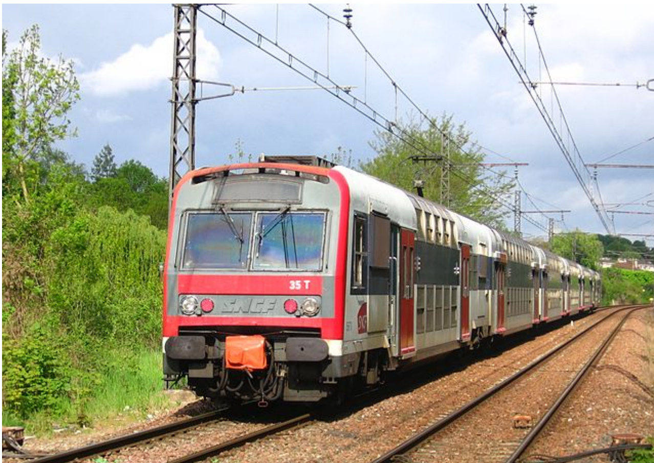
FIGURE 1. – Une Z5600 avec l'ancienne livrée.

D'abord, il y a les Z5600 ↗ , les toutes premières Z2N livrées dans les années 1980. Elles sont mono-courant 1500 volts continus, on ne peut donc pas les croiser sur la VMI. On peut les trouver aussi sur le RER D ou la ligne R.