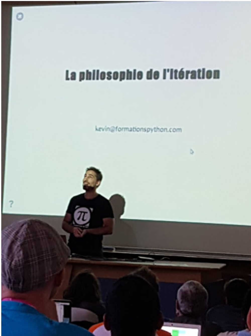
FIGURE 1. – **La philosophie de l'itération**

Un contenu très pédagogique sur la boucle for et le protocole d'itération en Python. Introduite comme une présentation du for , elle va bien au-delà en abordant des notions comme l' unpacking , les générateurs ou le slicing .