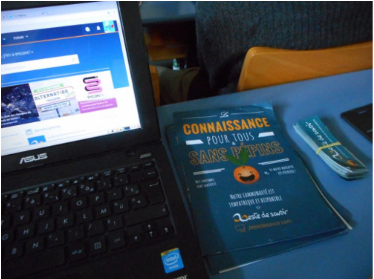
FIGURE 2. – On était là !