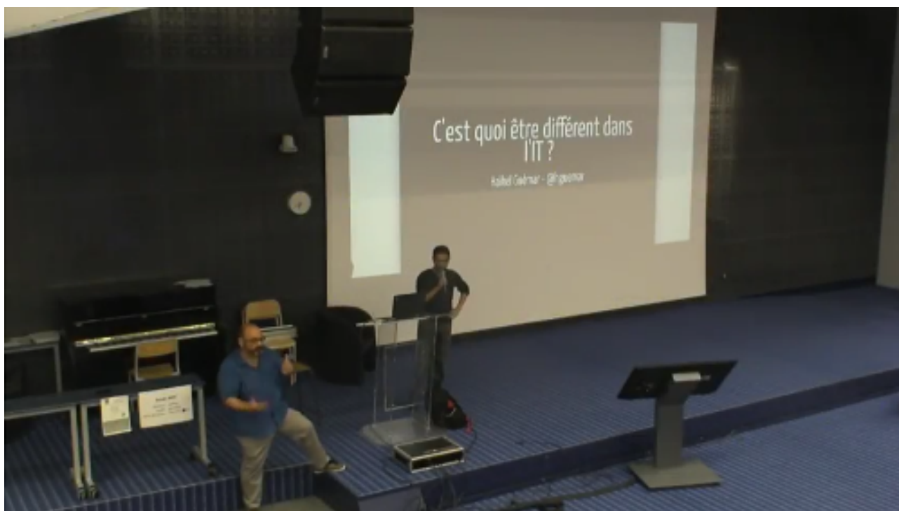
FIGURE 1. – C'est quoi être différent dans l'IT – © [Python Toulouse]( https://www.youtube.com/watch?v=xYPokaODvnQ )

Une conférence qui met en évidence les discriminations souvent minimisées dans le milieu de l'informatique.