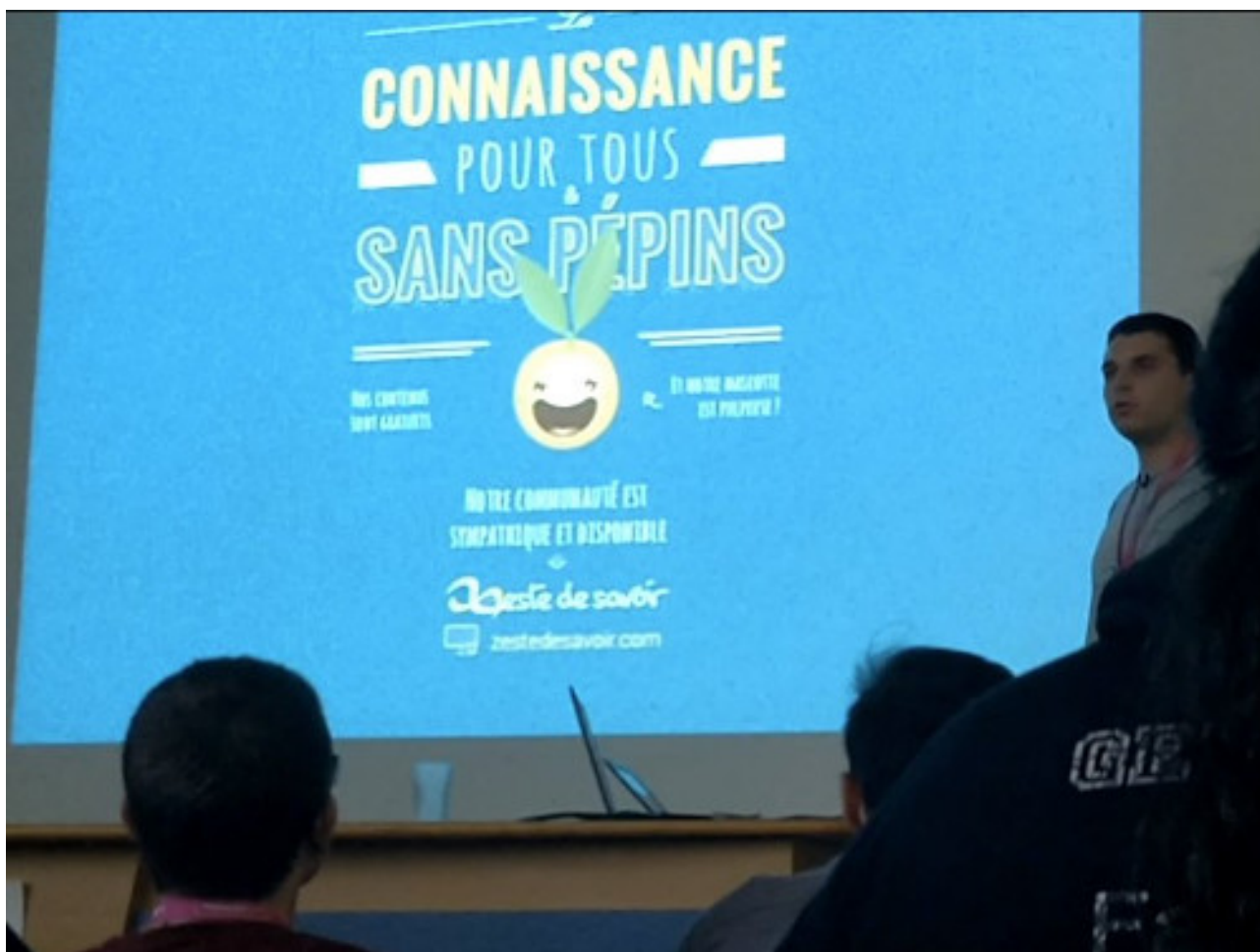
FIGURE 2. – Et là, aussi.

Quelques personnes, du domaine de la programmation ou de l'éducation, se sont montrées curieuses à propos du site. Toutes trouvaient intéressante l'idée de rassembler en un même endroit différents domaines de savoir, étaient conquises par l'aspect collaboratif et la validation des contenus.