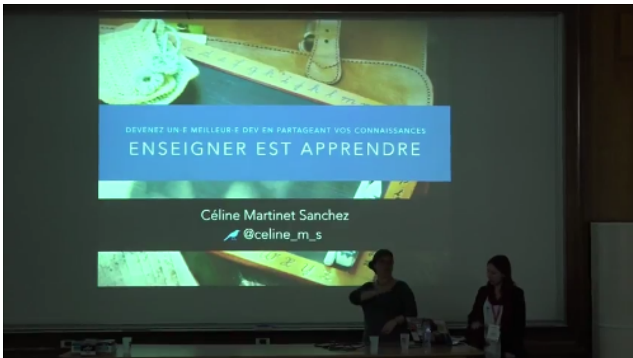
FIGURE 1. – **Enseigner est apprendre** – © [Python Toulouse]( https://www.youtube.com/watch?v=6DR31EBAE_A )

L'auteure explique ici comment elle a progressé quand elle s'est lancée dans la rédaction de cours. Maintenant formatrice de profession, elle explique en quoi il est bon, pour apprendre de nouvelles notions, de chercher à les enseigner.