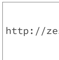
FIGURE 3. – Comparaison entre deux séquences. En bleu, les bases en commun.

Mais qu'est-ce que la distance entre deux espèces ? Prenons deux séquences d'ADN :