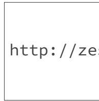
FIGURE 3. – Arbre de départ, en étoile

Nous allons calculer une nouvelle matrice des distances, prenant en compte les distances totales d'une espèce avec les autres espèces. Je vous épargne le long développement permettant d'arriver à la formule suivante :