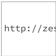
Figure : Typologie 1 : deux possibilités, soit les noeuds internes sont G , et il y a eu deux mutations de G vers C , soit les noeuds internes sont C et il y a eu deux mutations de C vers G . On a donc minimum deux événements évolutifs.

On considère chaque caractère séparément et on construit tous les arbres possibles. Donc, pour le premier caractère (GCCG), on construit les trois arbres (non racinés) possibles. Pour chacun de ces arbres, on compte le nombre d'événements évolutifs nécessaires au minimum pour expliquer les données de ce site.