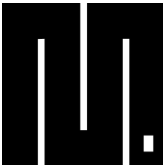
FIGURE 0.1. – Logo de MicroPython ( source ↗ ).

Cette lacune est comblée depuis 2014 par MicroPython, une implémentation de Python destinée aux microcontrôleurs, qui est accompagnée par un ensemble de cartes électroniques compatibles. Cette combinaison permet ainsi à tous de programmer dans leur langage favori pour la réalisation de leurs projets embarqués.