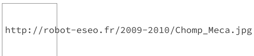
FIGURE 0. – Chomp, un robot de l'ESEO, auquel j'ai participé