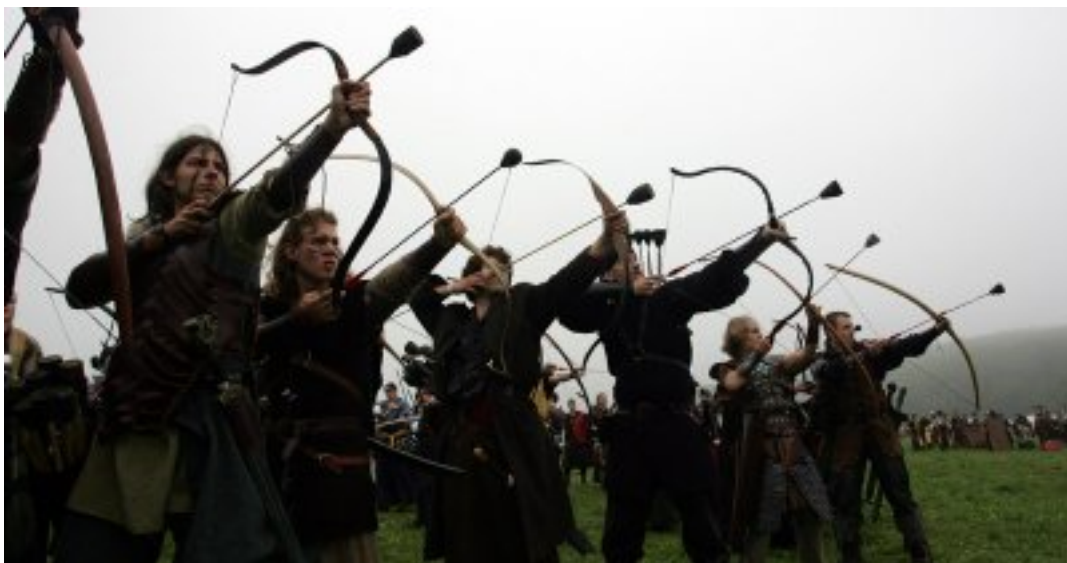
FIGURE 0. – Allez, une image de GN pour faire bonne mesure

Les deux ans après ma sortie de l'école, j'ai fait de la robotique dans l'équipe Atlantronic, composée principalement d'ingénieurs de Centrale Nantes, que j'ai rencontrés à l'occasion de mon master. Maintenant, je participe à l'organisation de l'événement (enfin, pas trop cette année, j'ai eu d'autres activités perso : du jeu de rôle sur table, du jeu de rôle grandeur nature, etc.).