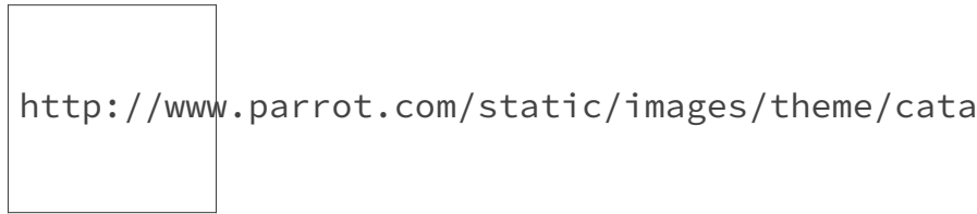
FIGURE 0. – Un drone