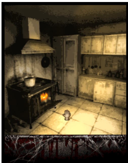
FIGURE 10. – Exemple d'effet de lumière. Le feu et l'éclairage sont animés en jeu.

Certaines salles disposent aussi de feux animés, dont l'animation et l'éclairage a été revu.