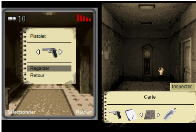
FIGURE 10. – Comparaison, à gauche l'interface de l'inventaire d'origine sur petit écran, à droite le remake (sans upscaling)

10.2.3.2. Inventaire L'inventaire n'affiche plus un seul objet à la fois, mais jusqu'à 5. Leur ordre est celui de récupération en jeu. Le déplacement dans le menu est cyclique, aller à droite longtemps ramène au début de l'inventaire.