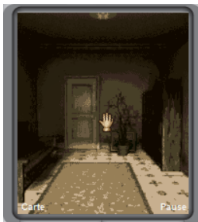
FIGURE 6. – Capture d'écran du jeu d'origine.

Il semblait donc bien important pour les développeurs que la carte soit trouvée rapidement, ils avaient donc probablement bien conscience de son importance avec un rendu aussi limité. C'est l'unique usage de cet objet.