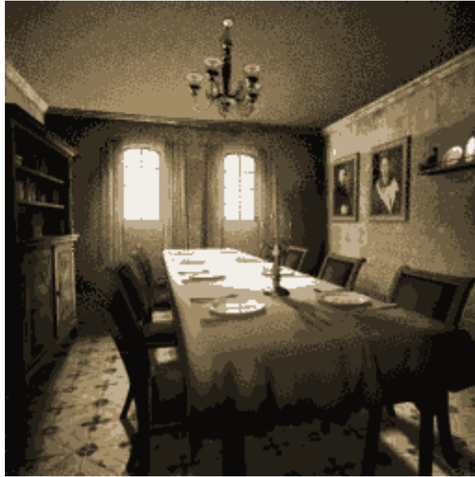
FIGURE 6. – Asset extrait du jeu : la salle à manger dans son entièreté.