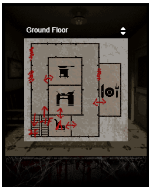
FIGURE 10. – Capture du remake : affichage revu de la carte

10.2.3.1. Carte La carte ne nécessite plus le chemin indiqué plus haut : à l'appui sur une touche, on affiche l'étage actuel. Les flèche haut et bas suffisent pour changer d'étage affiché. Elle apparaît par-dessus la vue actuelle au lieu de représenter un menu complet presque "hors jeu" (fond noir, jeu en pause).