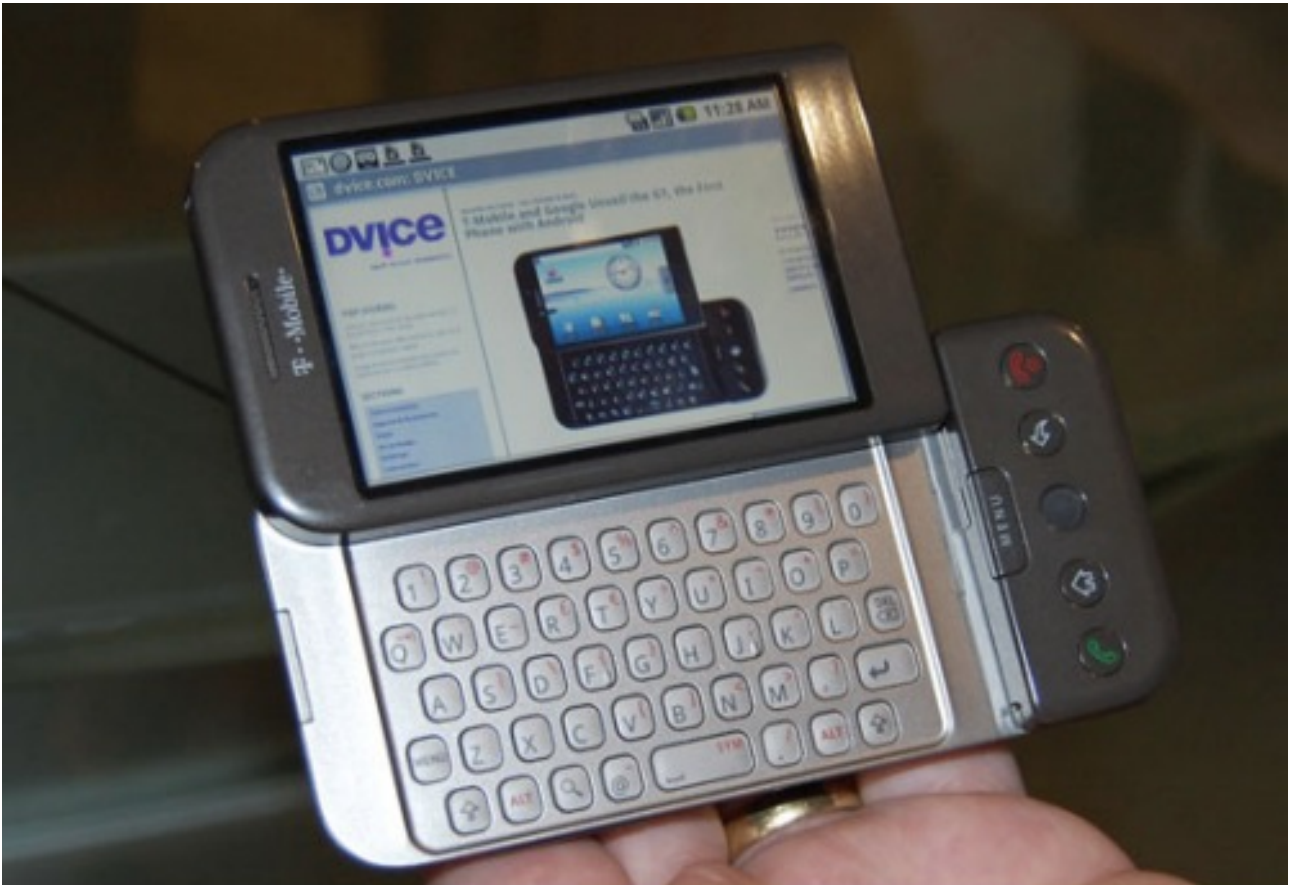
FIGURE 4.

Pour resituer un peu l'état du marché mobile en 2007, nous sommes un an avant la présentation du tout premier téléphone grand public tournant sur Android. Et Android, à l'époque, c'était ça :