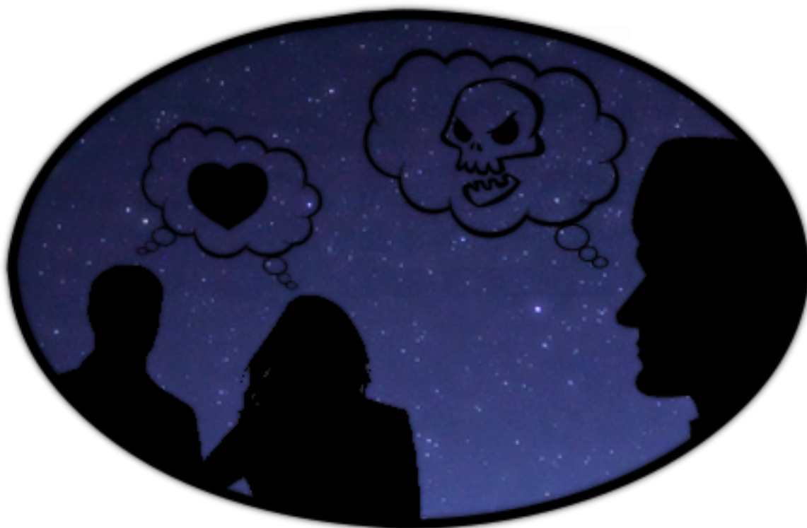
FIGURE 1.2. – Le contexte