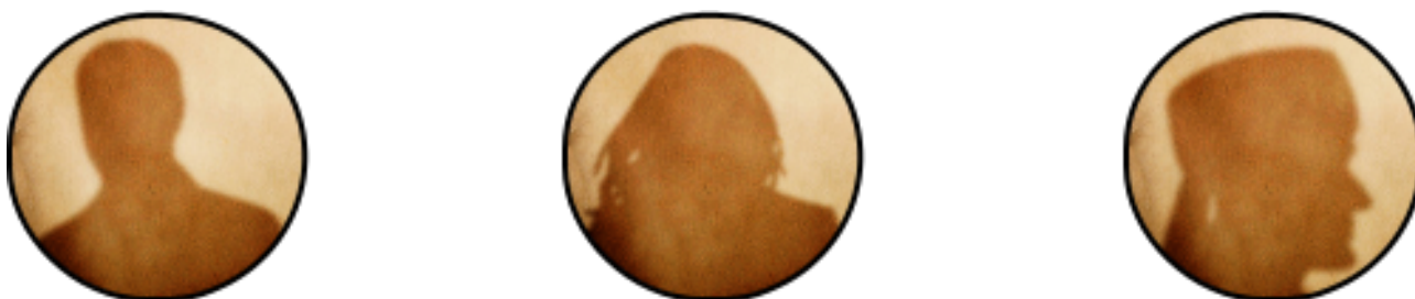
FIGURE 1.1. – Adalbéron, Brunehaut et Ébroïn

Pour désigner les personnes impliquées dans une opération de chiffrement, on pourrait parler de personne A, personne B, personne C, etc. Mais cette solution serait assez déshumanisée. C'est pourquoi, dans les exemples, on a pris l'habitude de parler d'un couple d'amoureux appelés Alice et Bob, qui tentent de s'écrire sans être dérangés par la vilaine Ève, qui leur veut du mal sans qu'on sache trop pourquoi. Pour ma part, je ferai preuve d'un peu d'originalité, en vous parlant du sympathique Adalbéron , qui désire envoyer quelque missive enflammée à sa douce Brunehaut , sans que le perfide Ébroïn ne vienne y mettre son groin.